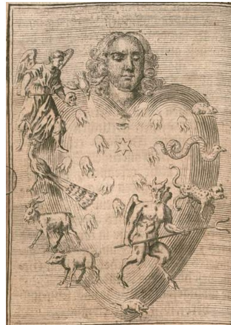
Johann Salver, Geistlicher Seelen-Spiegel, Würzburg 1733

Mit Blick auf die Gegenwart wollen wir erwägen, wie sich die reformatorische Anthropologie heute fassen lässt, in welchen Phänomenen der Gegenwartskultur sich Spuren einer solchen Sicht auf den Menschen entdecken lassen und wie sich nicht zuletzt Rechtfertigung vor dem Hintergrund solcher Phänomene neu verständlich machen ließe.